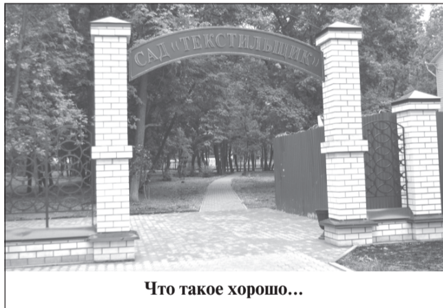
Что такое хорошо...

Однако главной проблемой города за текущий год стали разрушенные здания. Превратившиеся в груды мусора, они находятся повсеместно. К снесённым аварийным домам прибавились сгоревшие здания на ул. Революционной. И рядом со сквером — тоже, и в центре, возле управления комбината. Про этот участок надо сказать особо — он зарос бурь-