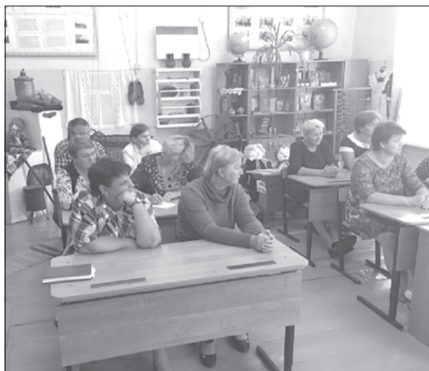
Число наказов от избирателей не уменьшается.

В г. Плесе и с. Рождествено состоялись выездные встречи Приволжской общественной приёмной с педагогическими коллективами школ.