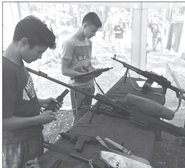
Идёт сборка автомата.

В Ивановской области прошли межрегиональные соревнования, посвященные Дню спецподразделений России.