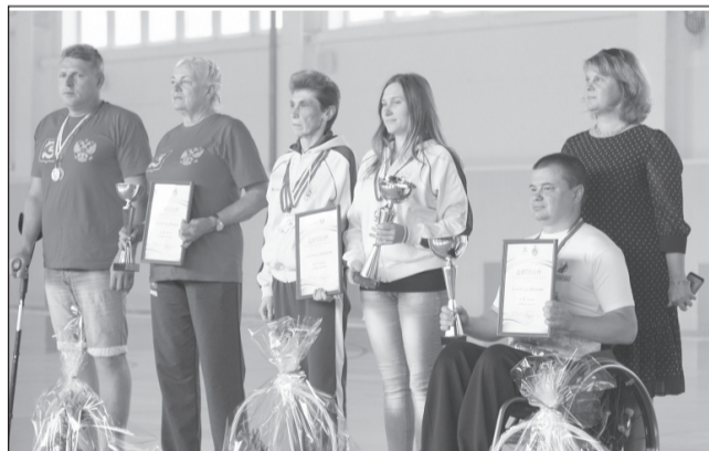
Победители юбилейной региональной параспартакиады.

люди с ограниченными возможностями здоровья в возрасте от 19 до 60 лет. Они состязались в плавании, настольном теннисе, пауэрлифтинге, шахматах, прыжках в длину с места и в толкании ядра. Среди городских округов по итогам X Параспартакиады первое место по количеству наград заняли представители Кинешмы. Параспортсмены Родниковского района первенствовали среди муниципальных районов области.