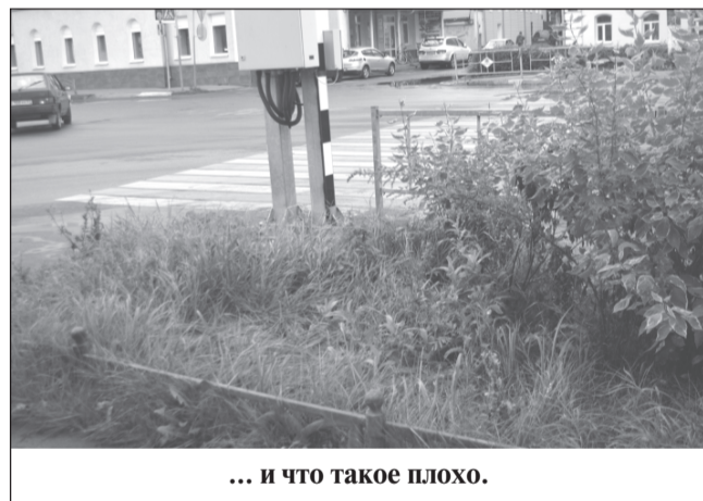
... и что такое плохо.

Пройдём в сад «Текстильщик». Сколько тревог вызывал он у жителей! После грандиозных строительных работ слабо верилось, что здесь когда-то может быть наведён порядок. Но он всё же наведён, пусть и не полностью, и до совершенства ещё далеко, но этот уголок города уже не вызывает обострённого чувства обиды, что с ним люди поступили так несправедливо. Дорожки выровнены, к ним сде-