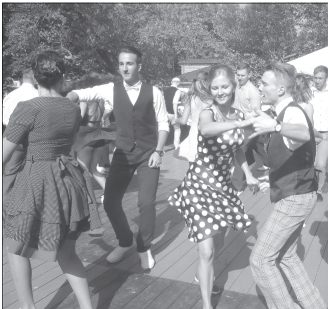
Буги-вуги в маленьком Плесе.

Гостями прекрасного праздника стали сотрудники нашей редакции, а также жители Плёса и те, кто приехал в маленький, но уже занявший лидирующие позиции в списке туристических центров России, городок на Волге. Газета «Плёские ведомости» отметила пятилетний юбилей.