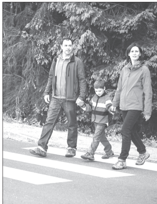
Родители - главные учителя на дороге.

Самое основное, что должен запомнить каждый родитель: главным учителем безопасного поведения на дороге для его ребенка будет не школа, а именно он. Школа может лишь закрепить те навыки и устойчивые привычки дорожной безопасности, которые вы сформируете в семье. Пока, к сожалению, педагоги вынуждены перечислять школьникам или отучать от неправильных знаний и вредных привычек, привитых взрослыми. Ведь если родители считают возможным нарушать правила дорожного движения, то и их дети будут вести себя точно так же. Они просто повторяют все, что делают мама и папа.