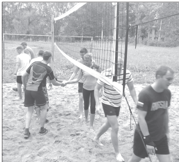
Участники соревнований по пляжному волейболу.

Подведем итоги спортивного года волейболистов за период 2017-2018 г. Многие были сделаны в плане подготовки и проведения соревнований. Все, что было запланировано, реализовано на практике.