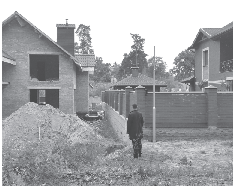
Документы на землю оформил - можно строиться.

Управление Росреестра по Ивановской области.