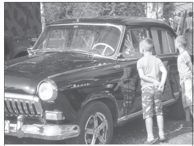
«Дяденька, дай порулить!»