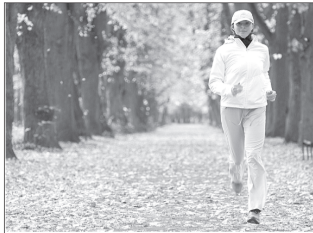
Занятие спортом - хорошее решение осенних болезней.

Вирусные инфекции развиваются по нескольким причинам. Люди сами угнетают свои верхние дыхательные пути курением табака, кальянов, использованием тяжелых парфюмов. Также развиваются и аллергические реакции, которые становятся причиной бронхолегочных проблем. На сниженном иммунитете все эти заболевания распространяются быстро. Также иммунитет снижается не только из-за вредных привычек, но и из-за стрессов, недосыпов, повышения концентрации воздуха с патогенной микрофлорой. Осенью может развиваться такое заболевание дыхательной системы, как ларингит. Его еще нередко называют «осенним» голосом - это низкий, осипший тембр. Сопровождается такая проблема обычно болями и першением в горле, проблемами при глотании.