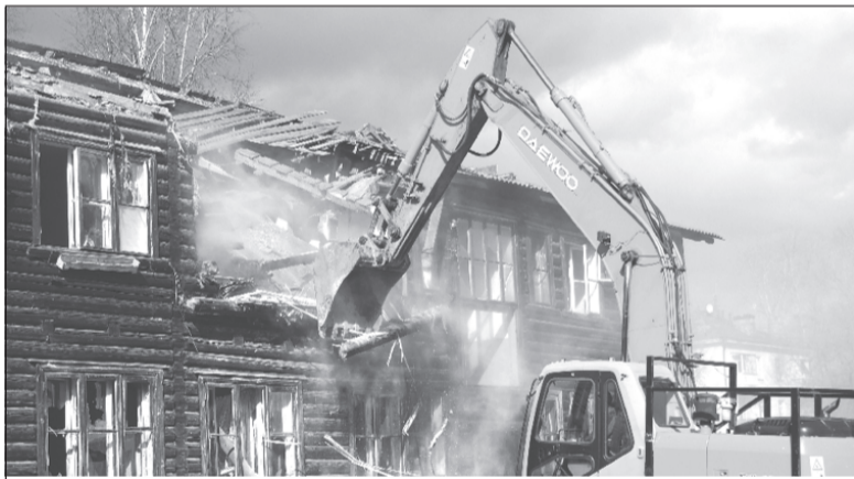
Пришло время избавляться от старого.

По требованию прокурора в г. Приволжске начат снос аварийных домов, представлявших угрозу для людей.